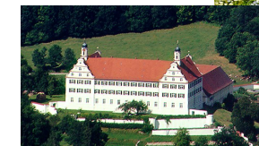
Galerie Schloss Mochental