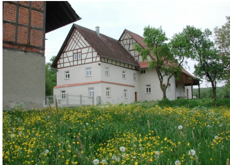
Der Ehinger Jägerhof

In mühevoller Kleinarbeit wurde das landwirtschaftliche Anwesen zu einem kleinen