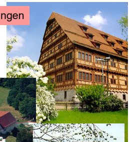
Museum der Stadt Ehingen

In Ehingen selbst erwarten die Gäste des Jägerhofes das weit über die Grenzen Ehingens bekannte Erlebnisfreibad sowie das für alle Altersklassen interessante und sehenswerte städtische Museum. Ein weiteres interessantes Ausflugsziel ist das Schloss Mochental, wo ständig wechselnde Ausstellungen geboten werden. Nicht weit entfernt ist der Grillplatz Ziegelhof, daneben befindet sich die Reithalle des Reit- und Fahrvereins Ehingen. Etwa eine Viertelstunde Fußweg entfernt ist das Ehinger Käppele zu bestaunen, von wo man einen herrlichen Blick über die Stadt Ehingen hat. Natürlich können Sie die Umgebung Ehingens auch auf Schusters Rappen oder auf gut ausgebauten Radwegen erkunden.